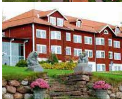
DALECARLIA HOTELL & SPA

EkOLOGISKA LANTBRUKARNA är ekoböndernas samlade kraft i Sverige. Ekologiska Lantbrukarna jobbar för att politik, regler och marknad ska vara utformade så att svenska ekobönder ges de bästa möjligheterna att utveckla lönsamma och hållbara företag.